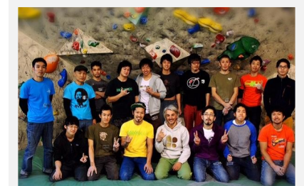
海外セッターを招いてのイベント