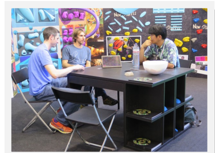
海外展示会での商談